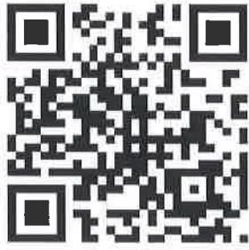
QR CODE สมัครเข้าร่วมโครงการฯ