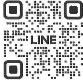
QR CODE งานส่งเสริมศาสนาฯ