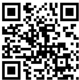
QR CODE สมัครเข้าร่วมโครงการฯ

๑๐.๑ ผู้ประสงค์สมัครเข้าร่วมการประกวดสามารถดาวน์โหลดใบสมัครและหลักเกณฑ์ได้ที่ www.bansuan.go.th โดยยื่นใบสมัครได้ด้วยตนเองที่ สำนักงานเทศบาลเมืองบ้านสวน ชั้น ๔ กองการศึกษา หมายเลขโทรศัพท์ ๐๓๘-๑๘๔๕๕๕ ต่อ ๖ หรือสมัครผ่าน Google Forms โดยสแกนผ่าน QR CODE “สมัครเข้าร่วมโครงการฯ” และสอบถามเพิ่มเติมผ่านแอปพลิเคชัน Line โดยสแกนผ่าน QR CODE “งานส่งเสริมศาสนาฯ” ตั้งแต่วันที่ - วันจันทร์ที่ ๒๕ พฤศจิกายน ๒๕๖๗ ในวันและเวลาราชการ